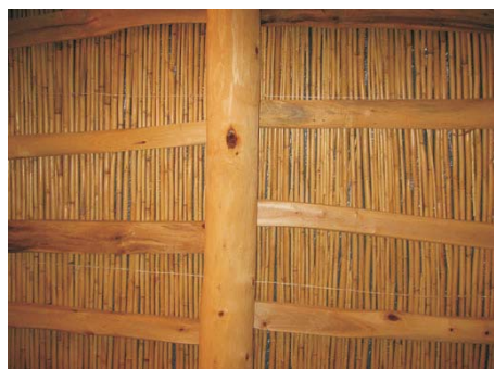
Azgour : fournisseur du roseau et tressage.

Tfraout : charpentiers. Taille des arbres et solives