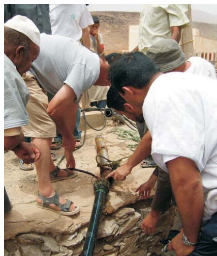
Dépannage d'une pompe hors service à Aït Icht