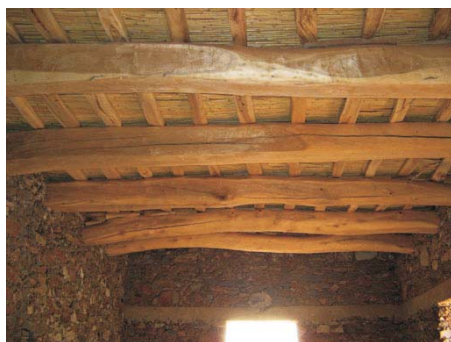
Poutres en bois de "Saff-Saff" d'Aït Icht

Tfraout : charpentiers. Taille des arbres et solives