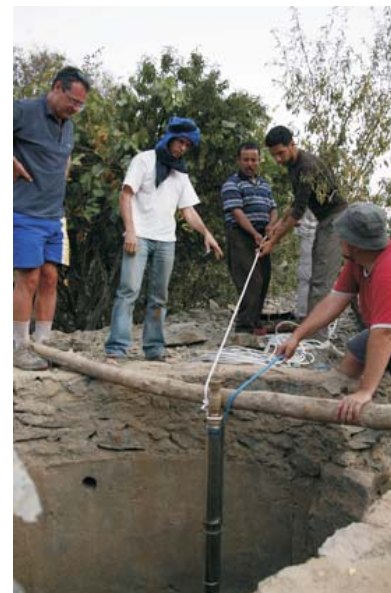
Installation d'une pompe au village d'Assaïs