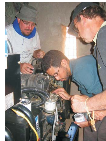
Installation d'un groupe électrogène à Sfraout