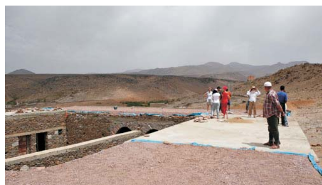
La couverture terminée de la maison commune d'Aït Icht